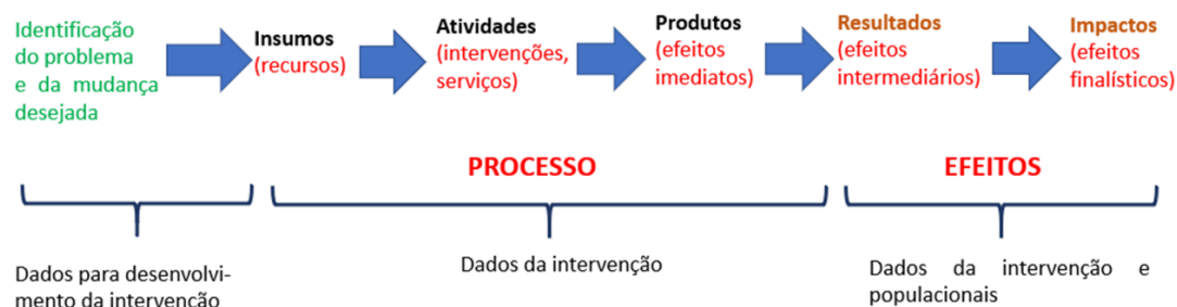
Figura 1 - Componentes do Modelo Lógico

Concomitante a isto, foi apresentado modelo lógico (figura 1) para guiar a construção das ações da PAS, sendo enfatizado também a consideração sobre a governabilidade de cada área e a factibilidade de execução no prazo de um ano.